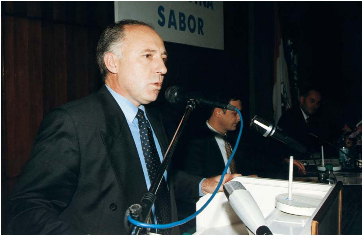
Predsjednik Skupštine Tuzlansko-podrinjskog kantona Izet Žigić

Novoizabrani predsjednik Skupštine Tuzlansko-podrinjskog kantona Izet Žigić se obratio riječima: