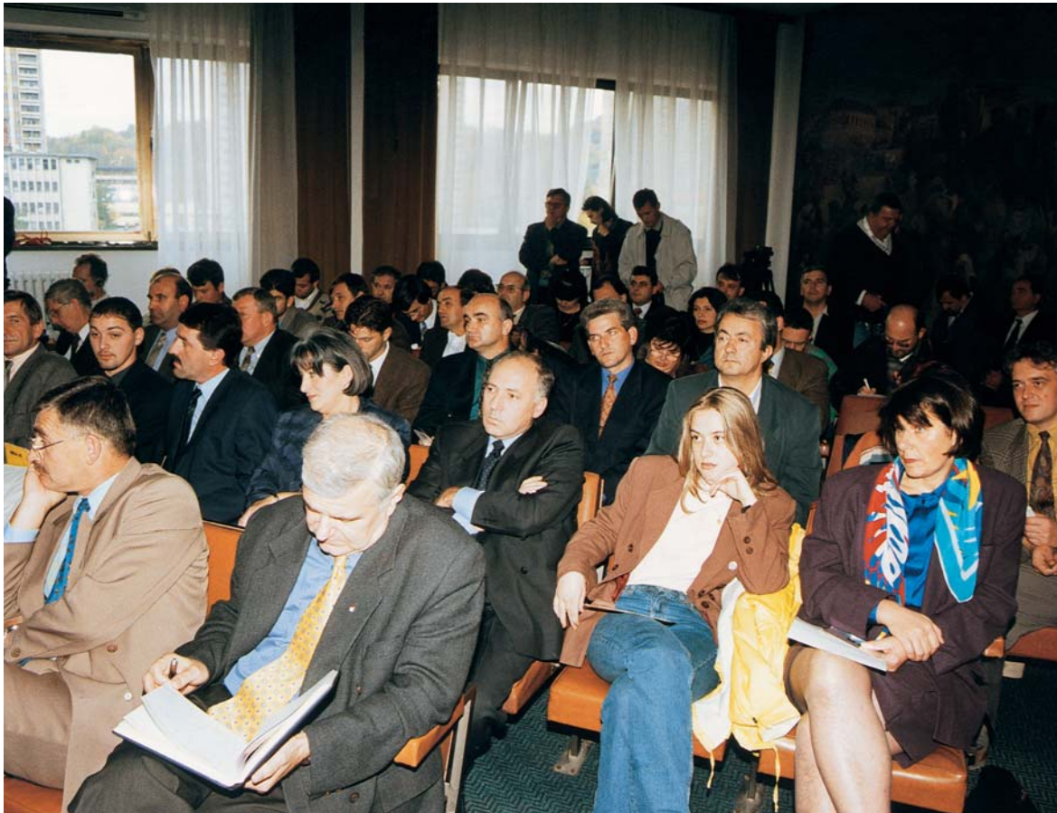
Poslanici Skupštine Tuzlanskog kantona na jednoj od skupštinskih sjednica

U analitičko-informativnoj djelatnosti značajno je napomenuti razmatranje informacija iz djelokruga rada Ministarstva unutrašnjih poslova, tužilaštva, Kantonalnog suda, informacija iz oblasti informisanja, šumarstva, stanja socijalne zaštite, stanja, opremljenosti škola, vodoprivrede, zaposlenosti, ulaganja u mrežu regionalnih puteva, projekata vodo-snabdijevanja, boračke i imovinske zaštite, te Analize ostvarivanja i zaštite ljudskih prava i osnovnih sloboda na području Tuzlanskog kantona.