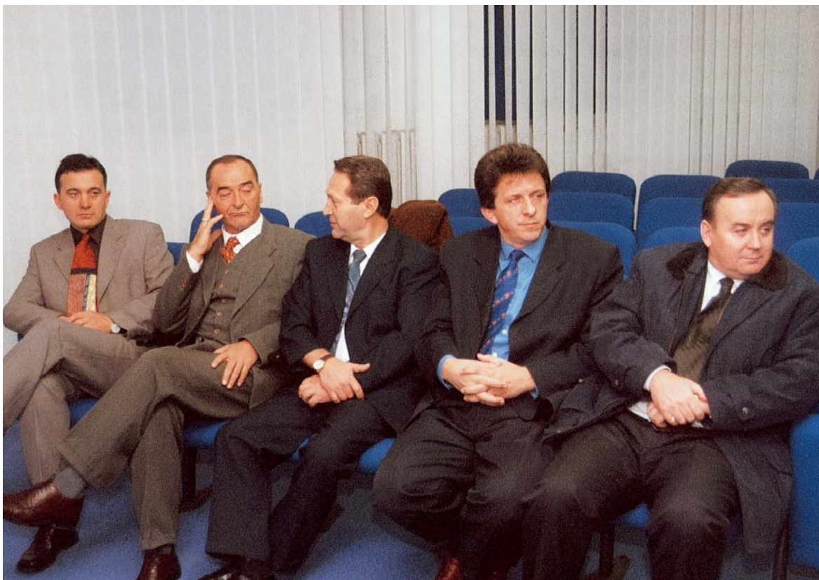
Članovi Vlade Tuzlansko-podrinjskog kantona u toku skupštinskog zasjedanja