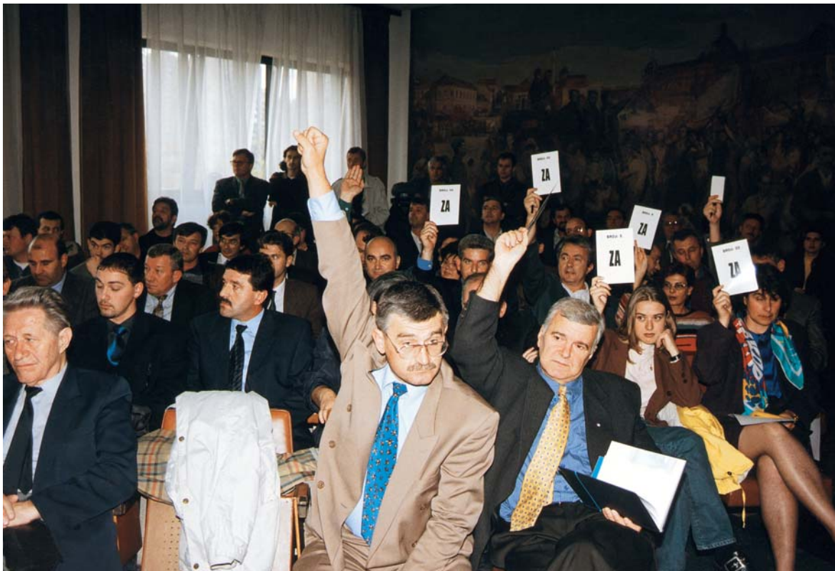
Glasanje poslanika na sjednici Skupštine

opravdanosti osnivanja odsjeka na fakultetima Univerziteta u Tuzli.