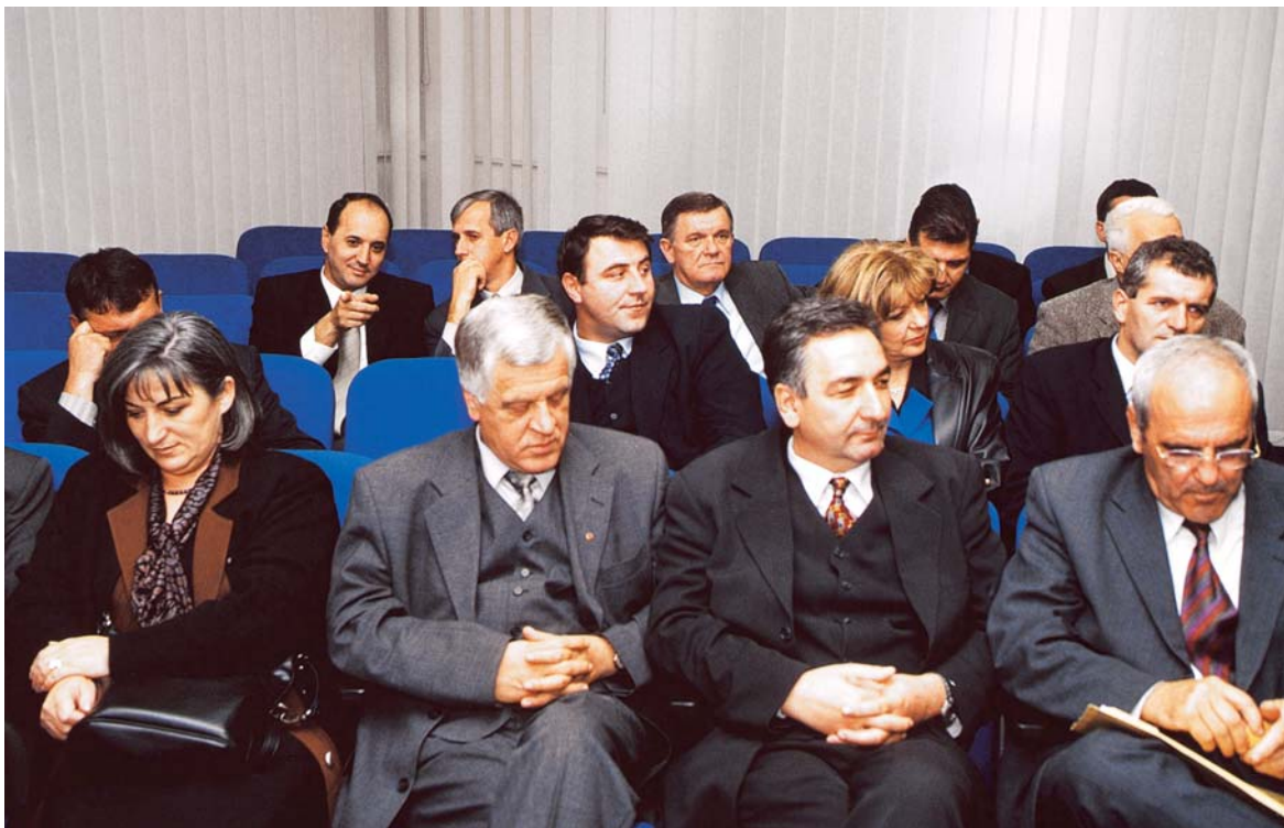
Dio Vlade TPK na sjednici Skupštine