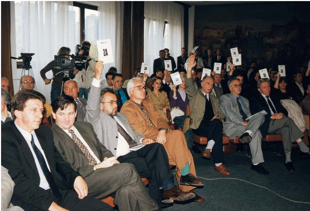
Glasanje poslanika na sjednici Skupštine

Aktivnost Skupštine Tuzlanskog kantona bila je planirana kroz donošenje Programa rada Skupštine Tuzlanskog kantona za 1999. godinu i Programa rada Skupštine Tuzlan-